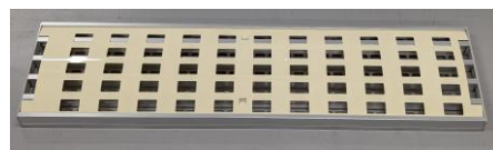
50%開口率のアルミニウム二重床の裏側に塞ぎ板2枚を重ねて使用します。