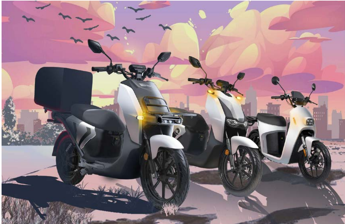
左から、Anoa (2 バッテリー、業務用)、Rimau (2 バッテリー)、Maleo (1 バッテリー)