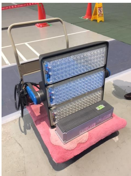
取り付けたフィリップスライティング社製 スタジアム照明