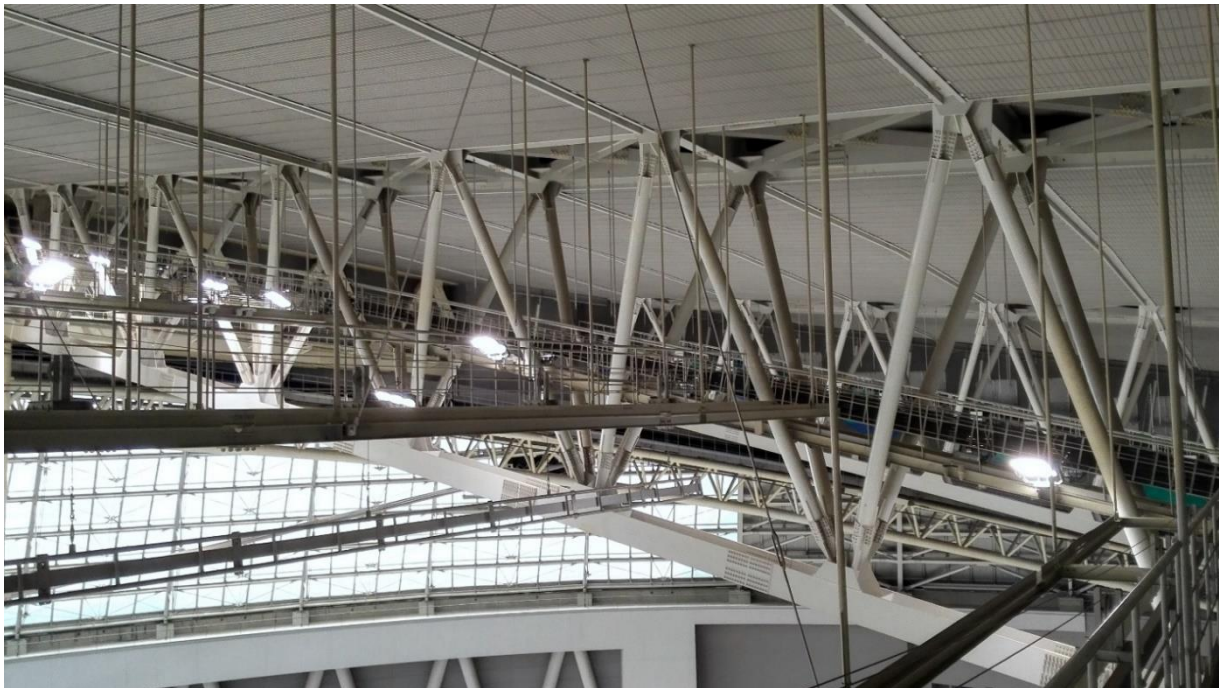
写真はLED化したコミュニティアリーナの照明