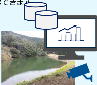
監視カメラを使えば画像確認も可能 ※監視カメラはオプションです

監視端末から「現在水位情報」「水位の変化量」「バッテリー電圧」などが数値やグラフで確認できます。