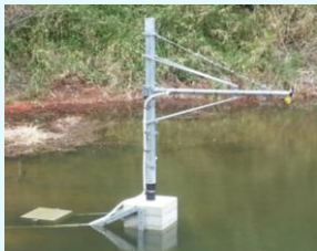
ため池に設置した水位センサー

水位センサーをため池の所定場所に設置。水位のデータは無線通信を経由して、一定間隔でクラウドサーバへ送られます。