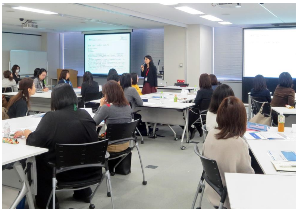
写真は、「女性活躍推進役」の定例会議の様子