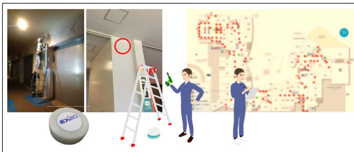
図4：ビーコン設置場所サンプル