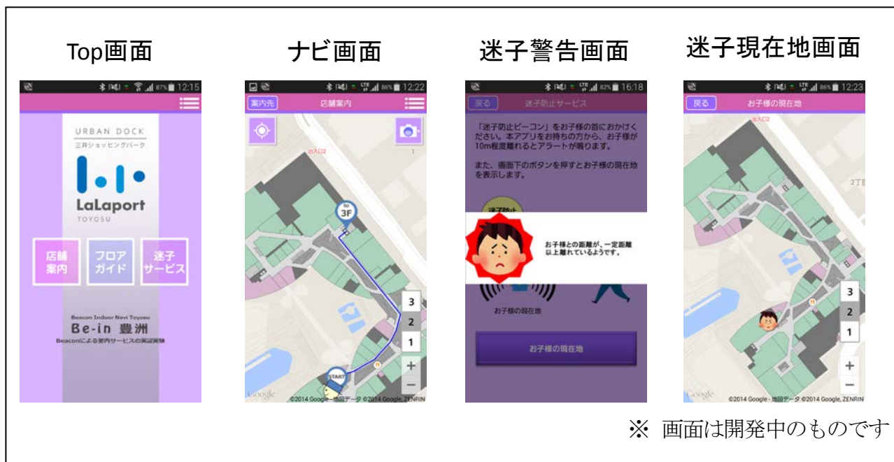
図2：スマートフォンアプリ画面サンプル

■迷子用ビーコンを持つお子さまが一定以上離れた場合にアラームを発する「迷子サービス」や「迷子の現在地検索」など、施設来訪者の安全性を向上させる位置情報の活用についての検証