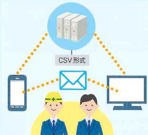
水位上昇警告（関係各所PC画面）

警告画面で事前に閾値を登録しておくことで、水位計から通知される水位上昇警告などをメールで通知します。