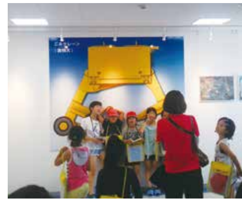
ごみクレーンの実物大写真(イメージ)