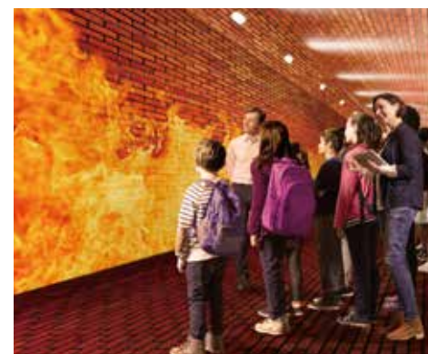
プロジェクションマッピングによる映像シアター(イメージ)